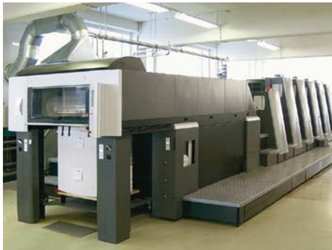
Die neue Heidelberg Speedmaster XL75-5+LX2 mit vollautomatischem simultanem Plattenwechsel.