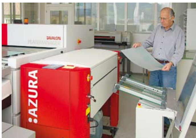
Mit dem Einsatz eines :Azura-CTP-Belichters von Agfa kann die Brunner AG auch in der Plattenbelichtung auf den Einsatz von Chemie verzichten.

Um die technische Ausstattung macht man in Kriens kein grosses Aufheben, es ist Mittel zum Zweck, die eingangs erwähnte pointierte